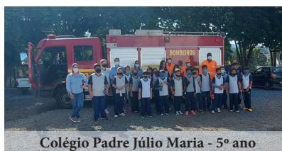
Colégio Padre Júlio Maria - 5º ano