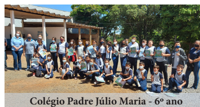
Colégio Padre Júlio Maria - 6º ano