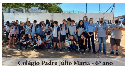
Colégio Padre Júlio Maria - 6º ano