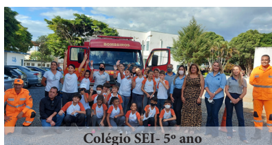
Colégio SEI - 5º ano