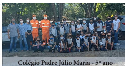
Colégio Padre Júlio Maria - 5º ano