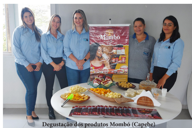
Degustação dos produtos Mombó (Capebe)